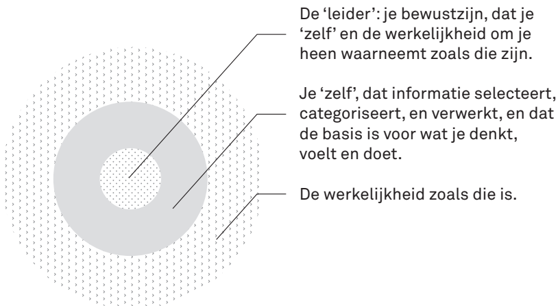
FIGUUR 2 Leidinggeven aan jezelf: de leider, het zelf en de werkelijkheid om je heen

Martin Luther King had een verlangen. Dat verlangen kwam voort uit zijn zelf, dat in de loop van zijn persoonlijke geschiedenis was gevormd. In die zin was zijn verlangen persoonlijk; het bestond aanvankelijk alleen in zijn binnenwereld. Het werd gevoed door wat hij in de loop van zijn leven gezien en ervaren had. Maar hij was zich daarvan bewust. Steeds ondervroeg hij zichzelf, zijn overtuigingen en idealen, en zo bouwde hij aan een realistische, moreel hoogstaande en inspirerende visie. De relatie met de werkelijkheid – zijn voortdurende en kritische ondervraging van zichzelf – voedde zijn verlangen, en gaf hem richting. Het maakte hem tot een realistische dromer. Zijn zelfbewustzijn voedde zijn visie, en zorgde voor een innige relatie met zijn volgers, wiens lot hij ten diepste begreep.